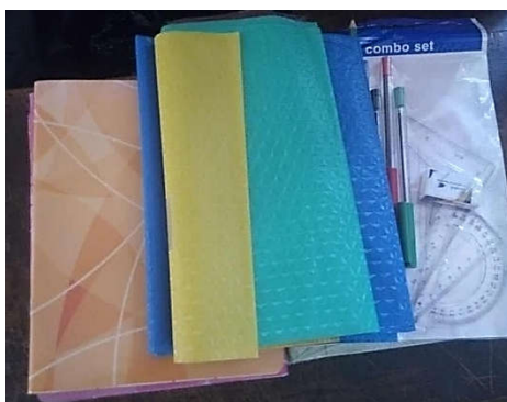
Les fournitures scolaires