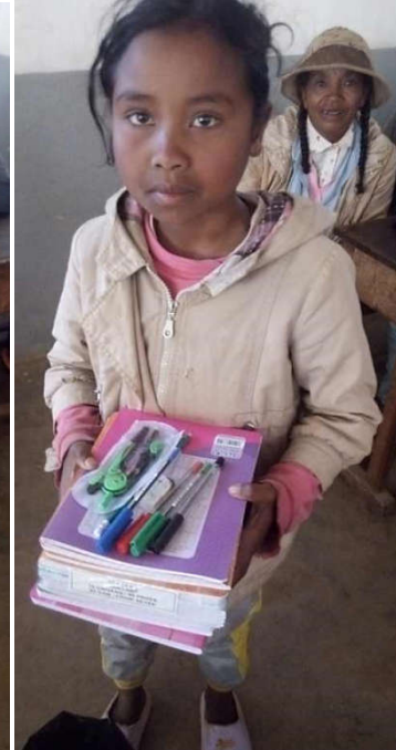
Muria 9 ans