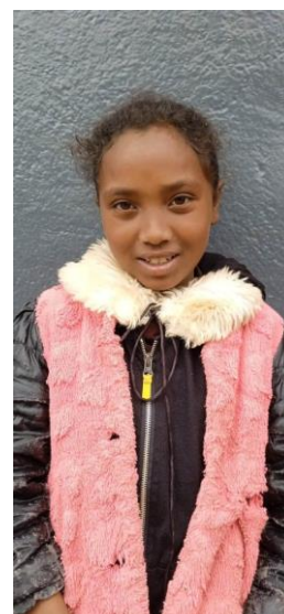
Fenosoa 12 ans