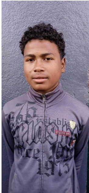
17 ans en 4 ème