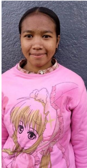
18 ans en terminale