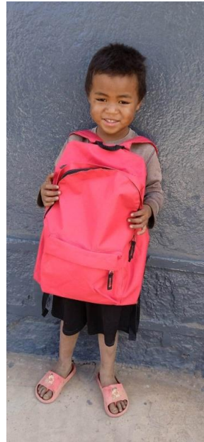
Valimbavaka 4 ans