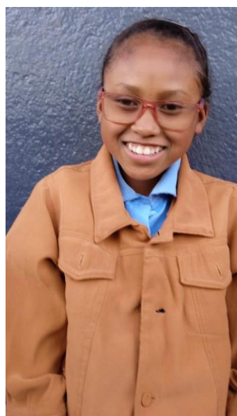
13 ans en 6 ème