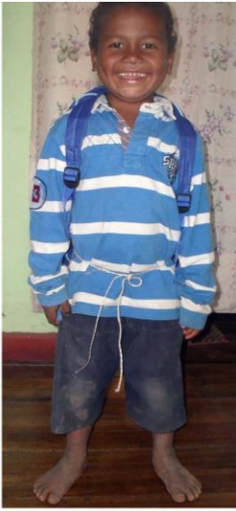
Bridot 6 ans CP 2