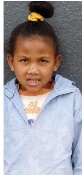
Muria 8 ans