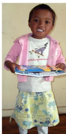
Finaritra 4 ans