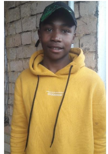
18 ans en 5 ème